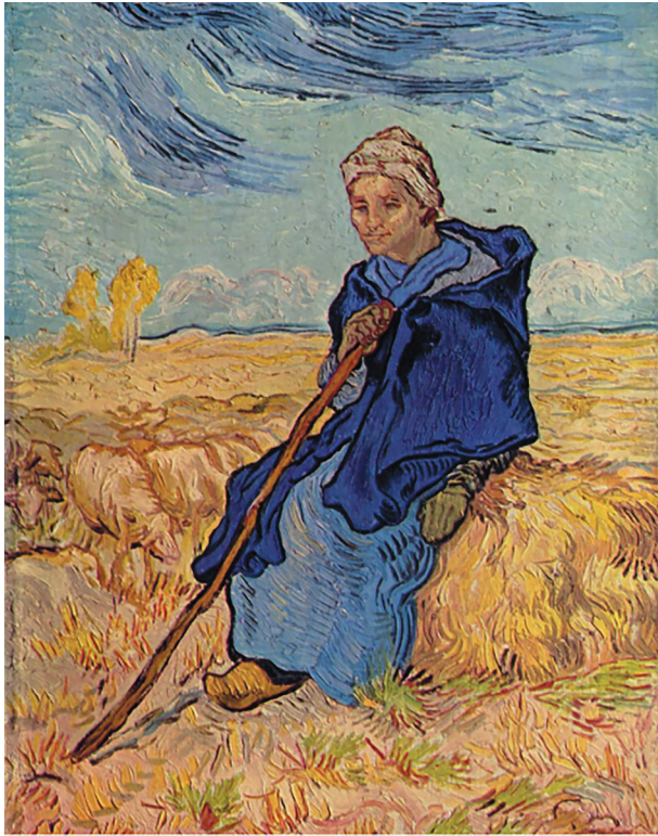
Vincent van Gogh, Pastýřka

Hospodin je můj pastýř; ... I když půjdu roklí šeré smrti, nebudu se bát ničeho zlého, vždyť se mnou jsi ty. Tvoje berla a tvá hůl mě potěšují.